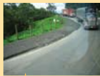
アンデスの坂をバスが爆音を上げてよじ登る

メデジンにはまた夜着いてしまった。明るいうちに着きたかったのだが、そうはうまくいかない。バスターミナルから鉄道駅に一人早足で向かいたのだが、電灯