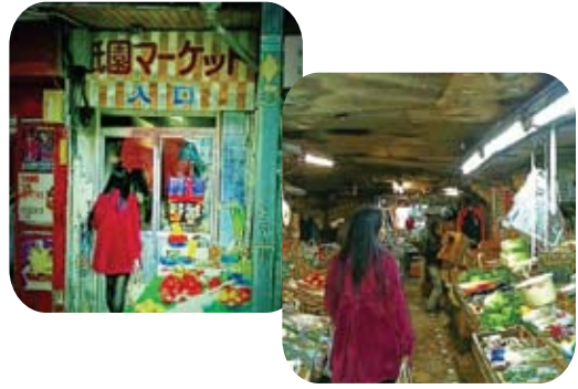
福岡市博多区上川端町2 祇園ビル1階