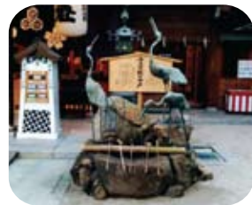
福岡市博多区上川端町1-41 榊田神社内