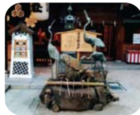
福岡市博多区上川端町1-41 榊田神社内